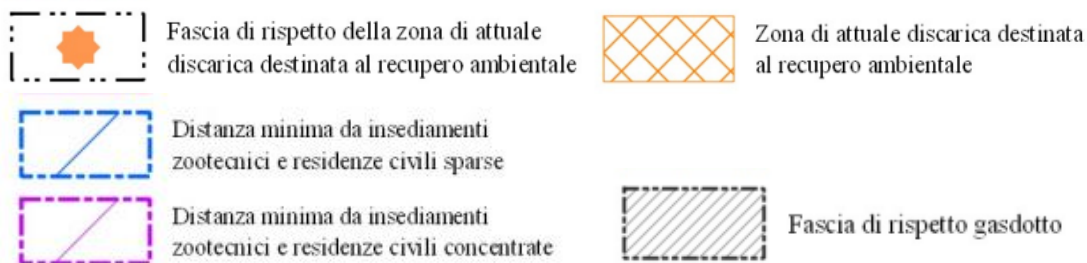
Figura 3.1.1: Estratto Legenda “Zonizzazione intero territorio comunale” della tavola 1.D [Fonte P.I. di Valeggio sul Mincio, 2019]