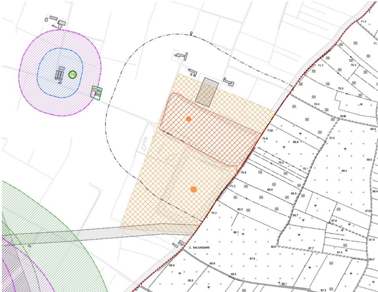
Figura 3.1: Estratto mappa “Zonizzazione intero territorio comunale” della tavola 1.D

Il sito in esame è stato classificato quale “Zona di attuale discarica destinata al recupero ambientale”.