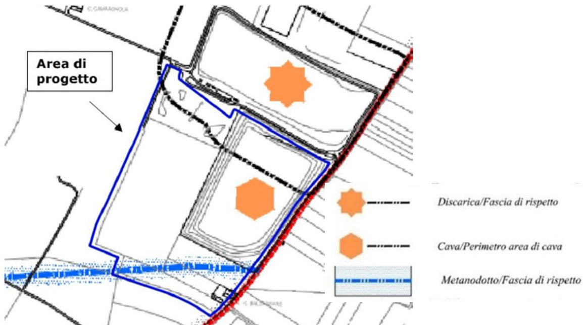
Figura 3.2: Estratto immagine della Carta dei Vincoli e della Pianificazione territoriale

In relazione alle previsioni degli strumenti urbanistici, il Procedimento – data la definizione di pubblica utilità, urgenza e indefettibilità dei lavori – fa automaticamente variante urbanistica.