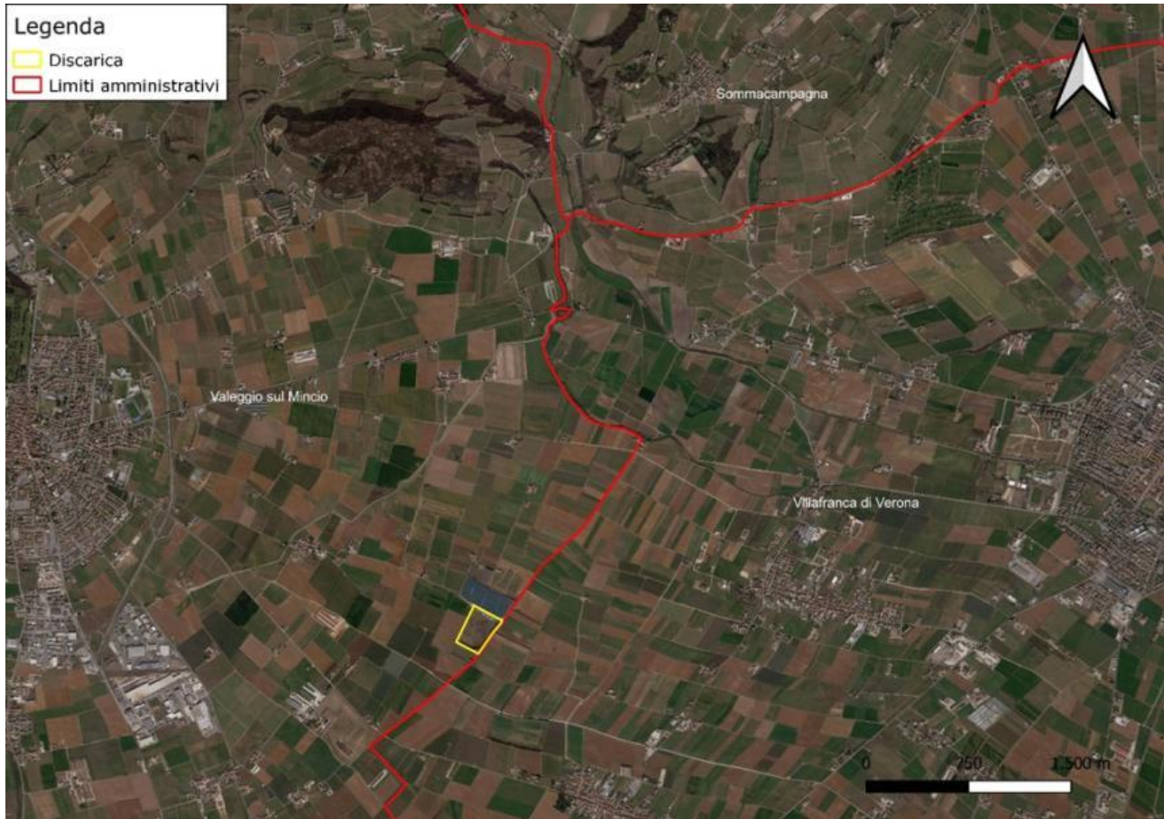
Figura 3.1: inquadramento territoriale dell'attività in oggetto [Fonte: inquadramento territoriale dell'attività in oggetto [Fonte: T.E.R.R.A. S.r.l.]]

Il sito è ubicato al confine con il Comune di Villafranca di Verona e dista 2,5 Km dal centro abitato in direzione est.